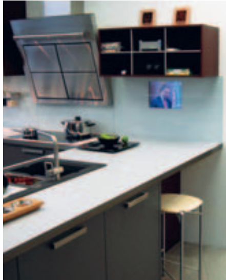
In der Küche integriertes Media-Center mit Bildschirm als zentrale Schaltstelle.

Die Haussteuerung lässt sich ebenfalls in das Media Center integrieren. Über KNX/EIB können Leuchten und Lichtgruppen gemäss den Wünschen der Bewohner geschaltet und gedimmt werden, Jalousien können auf Knopfdruck in bestimmte Positionen gefah-